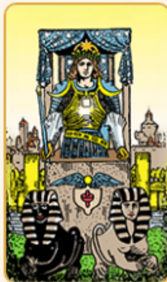
5 de Ouros + Carro